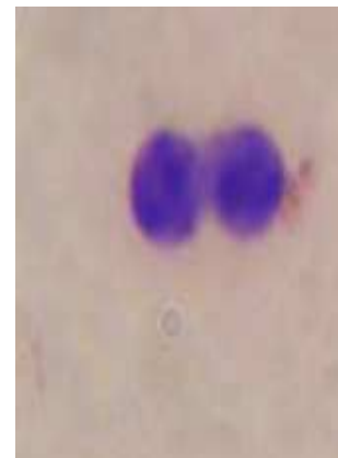
Рис. 3. Двоядерний лімфоцит (ДЯ)