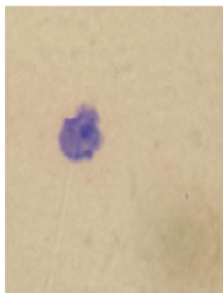
Рис. 1. Клітина з апоптозом (А)

Примітка: * — p \geq 0,99 , ** — при p \geq 0,95