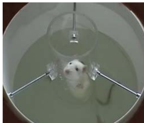
Рис. 1. Пристрій для проведення тесту екстраполяційного позбавлення

Що стосується безпосередньо когнітивних результатів тестування, то внаслідок проведених експериментів до завершення дослідного періоду було виявлено порівняно з його початком зменшення кількості тварин, які зуміли за відведені для цього 120 секунд успішно здійснити реакцію екстраполяційного позбавлення шляхом пірнання на 50 % у групі Д1 і 20 % — у групі Д2, відповідно (рис. 2).